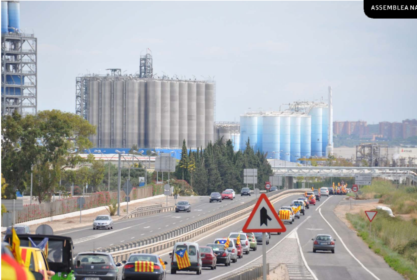
Marxa per la independència Falset-Reus, 22 juliol 2012