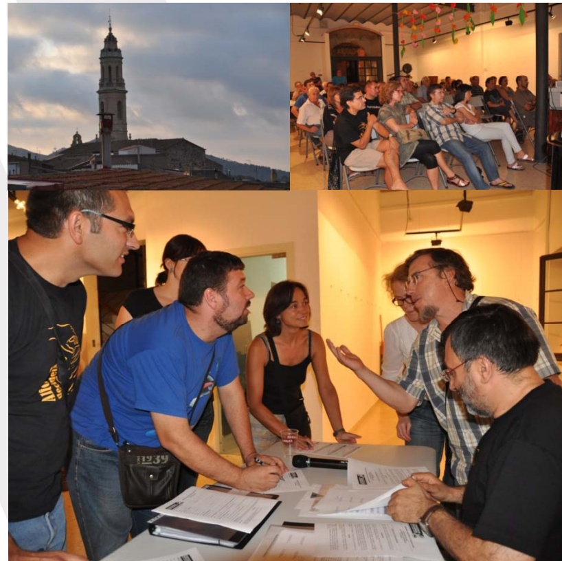
Constitució d'Alforja per la Independència, 9.09.2011