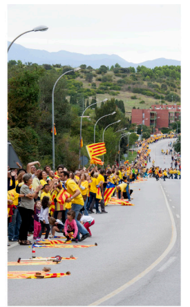
La Voie catalane

Près des 2/3 du Parlement de la Catalogne ont décidé de tenir un référendum