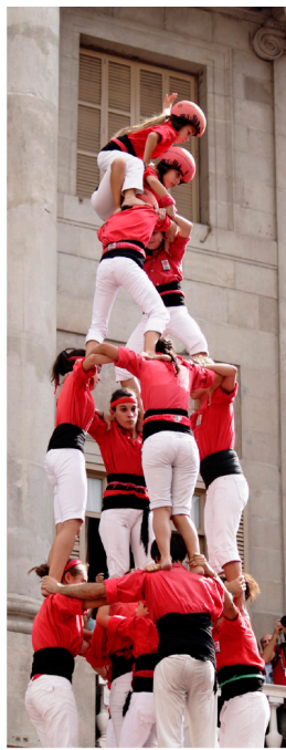
Les castells sont des tours humaines

Vous voici dans ce pays méditerranéen dont Barcelone est la capitale. Un pays de 7,5 millions d'habitants, avec sa culture, sa langue, sa gastronomie, mais aussi son Parlement, son gouvernement, ses lois. Un centre économique, industriel et touristique au sud de l'Union européenne, un territoire dynamique et ouvert sur le monde. Nous vous souhaitons un agréable séjour parmi nous!