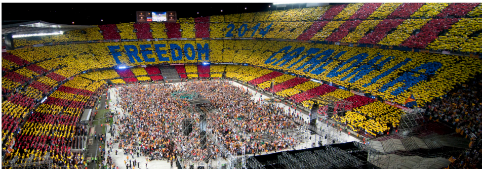
Le concert pour la liberté

La démocratie et le droit à l'autodétermination sont des principes généraux essentiels du droit international. Mais à la différence du Royaume-Uni avec l'Ecosse, le gouvernement espagnol s'y refuse. Il affirme que la Constitution espagnole l'interdit, bien que le gouvernement catalan ait identifié cinq façons légales d'organiser un référendum en Catalogne et appelle au dialogue pour sortir de l'impasse. Démocratie ou Constitution? Le refus n'est pas juridique, mais bien politique.