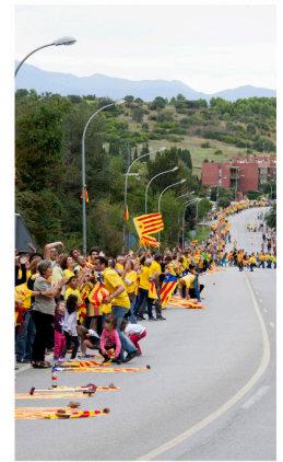
Der Katalanische Weg

Fast zwei Drittel des Parlaments von Katalonien haben die Durchführung eines Volksentscheids